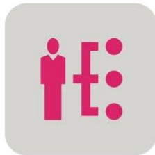
Bürger- und Unternehmensservices